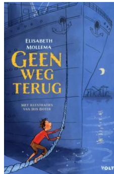
Geen weg terug Elisabeth Mollema vanaf 10 jaar