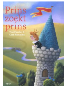
Prins zoekt prins Tiny Fisscher vanaf 5 jaar