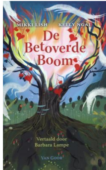
De betoverde boom Mikki Lish vanaf 10 jaar